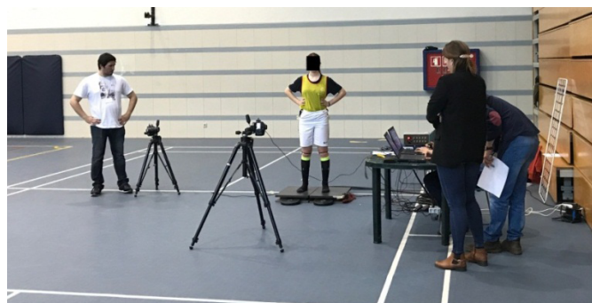
Figura 2. Disposição do material no local da colheita dos dados.

Na outra secção os restantes investigadores faziam o registo dos vídeos. Cada atleta realizou três saltos verticais sendo encorajados a saltar o mais alto possível. Os participantes eram preparados previamente com a colocação de 5 marcadores em cada perna, um na espinha ilíaca superior, dois nas interlinhas medial e lateral do joelho e mais dois nos maléolos lateral e medial, sendo colocados sempre pelo mesmo investigador para evitar vieses no estudo. Os saltos eram registados por duas câmaras CANON EOS 1100D®, uma no plano frontal e outra no plano sagital do lado direito, colocadas a 2,5 m do atleta, a uma altura de 1,5 m, e as imagens foram recolhidas a 30 fps (Fig. 2).