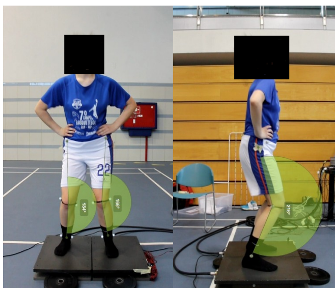
Figura 5. Exemplo de atleta que aterriza em valgismo e pouca flexão do joelho.