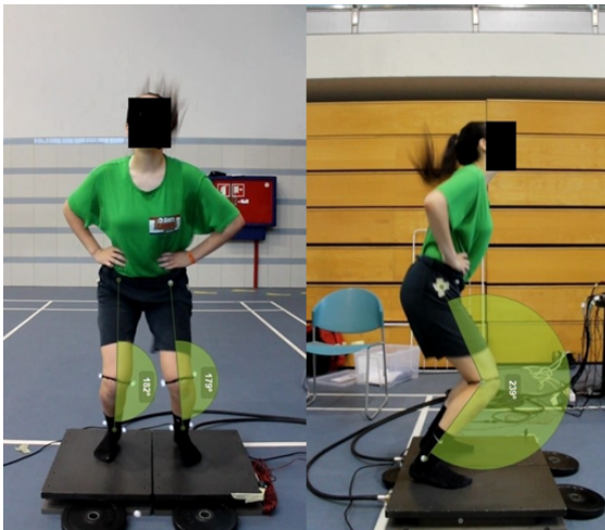
Figura 3. Exemplo dos ângulos medidos.